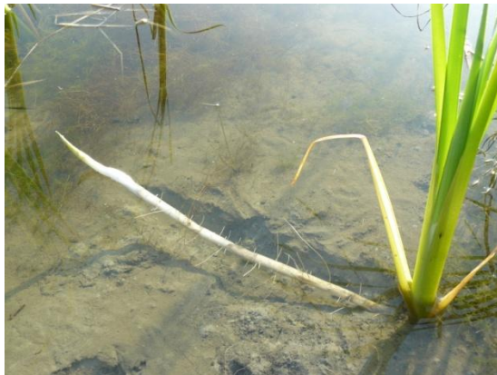
Foto 1. Grote lisdodde die zich het water in verspreidt.

In de Volgermeer willen we de ontwikkeling van veen stimuleren. Veenvorming start in open water wanneer dit begroeid raakt met planten. Dit kan gebeuren doordat planten zich in de waterbodem wortelen, of doordat drijvende wortelscheuten het water op groeien. Het dode plantenmateriaal wat deze planten produceren kan zich dan jaar na jaar opstapelen, waardoor uiteindelijk veen ontstaat.