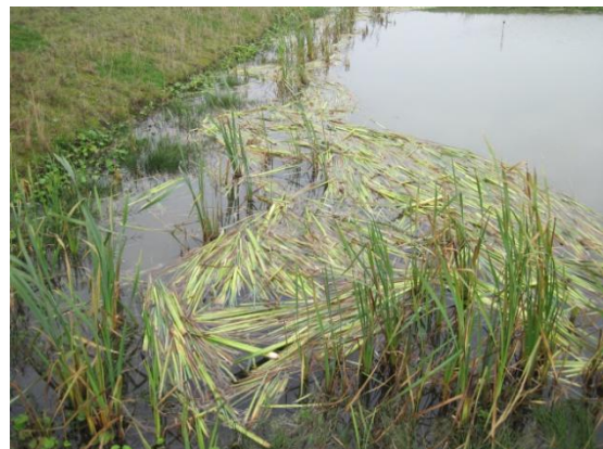
Foto 2. Los drijvende groene stengels van Grote lisdodde. Watervogels (wrs. Knobbelswanen) trekken de planten uit de bodem en eten de zachte witte wortels er af, waarna het blad achterblijft.

Om in te schatten of vogelvraat (uiteindelijk) de veenvorming kan beïnvloeden doen we in het Peatcap project onderzoek naar de invloed van vogelvraat op de uitbreiding van veenvormende plantensoorten. Dit experiment is in de Volgermeer te herkennen aan de drijvende vierkante matjes met verschillende niveaus van bescherming tegen vogels. Zo liggen er matjes zonder bescherming voor de planten, matjes met daarop een kooitje van kippengaas (alleen de planten op het matje zijn beschermd) en matjes die in